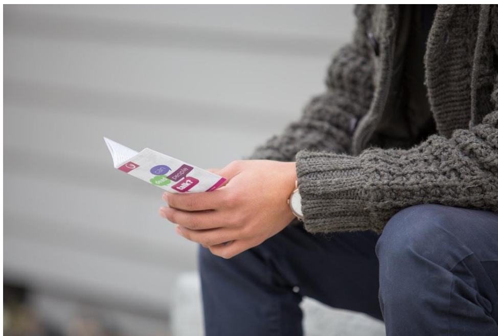
Figura 4 Robert Kooreny

Os folders são matérias de grande eficácia e podem ser feitos de diversas formas e tamanhos, podendo também se utilizar a criatividade para engajar mais pessoas.