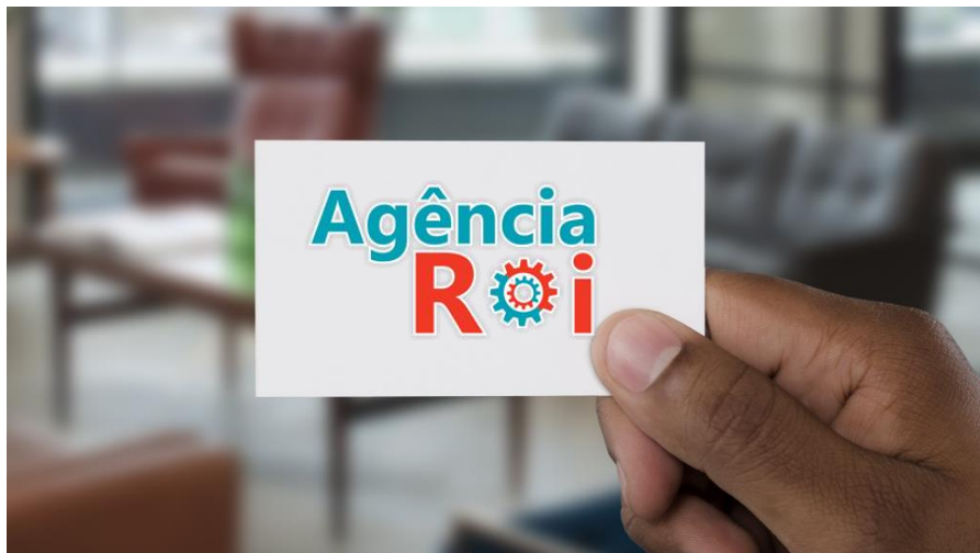
Figura 3

O bom e velho cartão de visita ainda é muito utilizado nos dias de hoje e pode ser a melhor maneira de captar clientes em encontros casuais ou em reuniões referentes ao seu negócio. Deve ser um material bem feito e pensado da melhor maneira possível pois por muitas vezes será a primeira impressão que seu cliente terá de você.