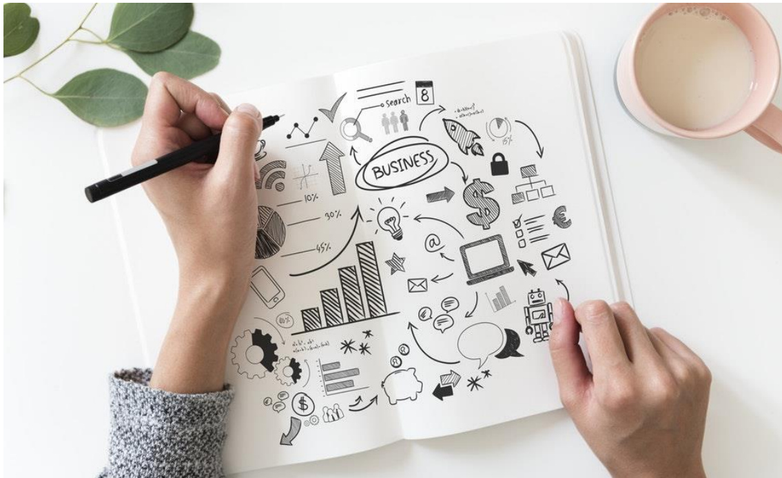
Figura 2

A nossa agência oferece 8 ações básicas para que seu negócio evolua, cumpra com os objetivos e tenha sua validação no mercado: